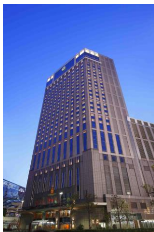
横浜ベイシェラトンホテル

爽やかな潮風を感じながら、のんびり手軽な近場旅。リゾート気分の余韻に浸りながら、夜は横浜ベイシェラトン ホテル&タワーズにステイし、ワンランクアップした“ごほうび旅”をご満喫ください。翌朝はこだわりの朝食メニュー「神奈川朝食」もホテルステイのお愉しみのひとつ。ゆっくりお部屋でご滞在いただいた後、横浜駅周辺の新スポットでショッピングを楽しむこともできます。長く続くおうちじかんのリフレッシュに、自分へのごほうびに、お友達やご家族と、カップルにもぴったりの夏の思い出づくりに最適な横浜ベイシェラトンだけのプランです。