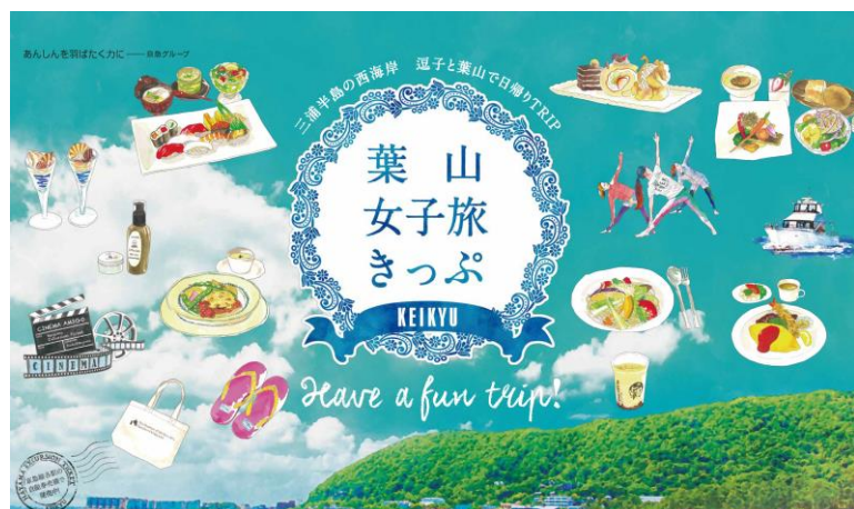
ぶらり、のんびりごほうび旅「葉山女子旅きっぷ」