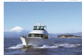
葉山マリーナでクルージング