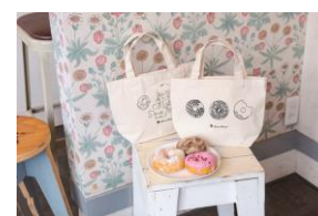
かわいいミサキドーナツ