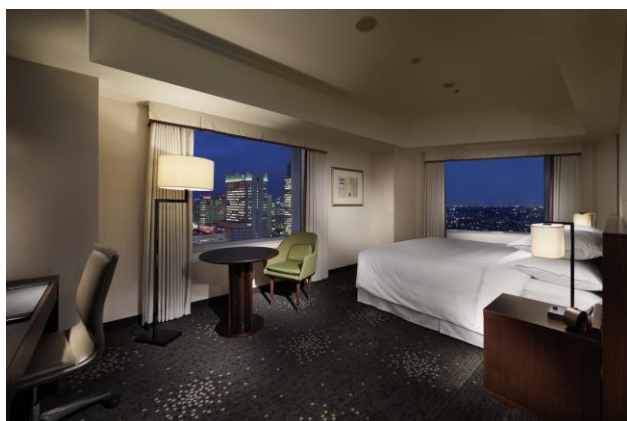
ゆったりとした客室で寛ぎの時間