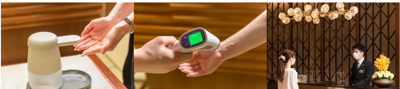
入店時の消毒・検温・接触・飛沫感染予防に関する対策